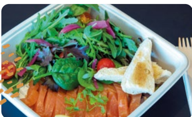
GRAVLAX DE SAUMON ACCOMPAGNÉ DE SALADE ET TOASTS