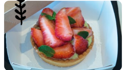
TARTE AUX FRUITS DE SAISON MAISON