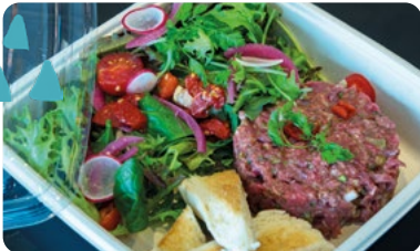
TARTARE DE BŒUF COUPÉ AU COUTEAU ACCOMPAGNÉ DE SALADE ET TOASTS