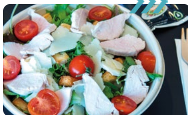
SALADE DU CHEF