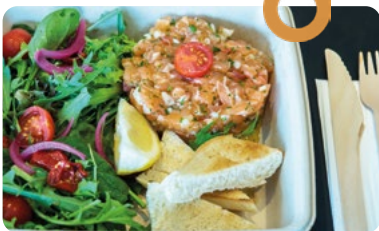
TARTARE DE SAUMON AU CITRON VERT ACCOMPAGNÉ DE SALADE ET TOASTS