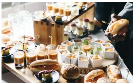
Repas de midi servi dans la salle de travail

Rapide et efficace : vous mangez tout en travaillant