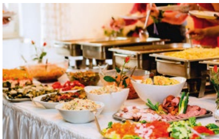
Buffet servi dans une de nos salles de banquet

Convivial et gourmand : le buffet, il y en a pour tous les goûts