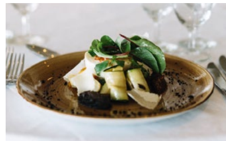
Repas de midi servi au restaurant ou dans une salle de banquet

Confortable et raffiné : vous préférez le service à table